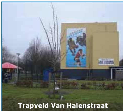
Trapveld Van Halenstraat

Plaatsen van twee hondenpoepafvalbakken bij speeltuinen Serviliusstraat en Deken Sourenplein.